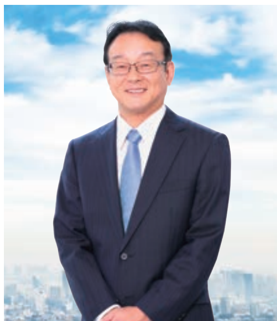
株式会社ルネサスイーストン 取締役社長